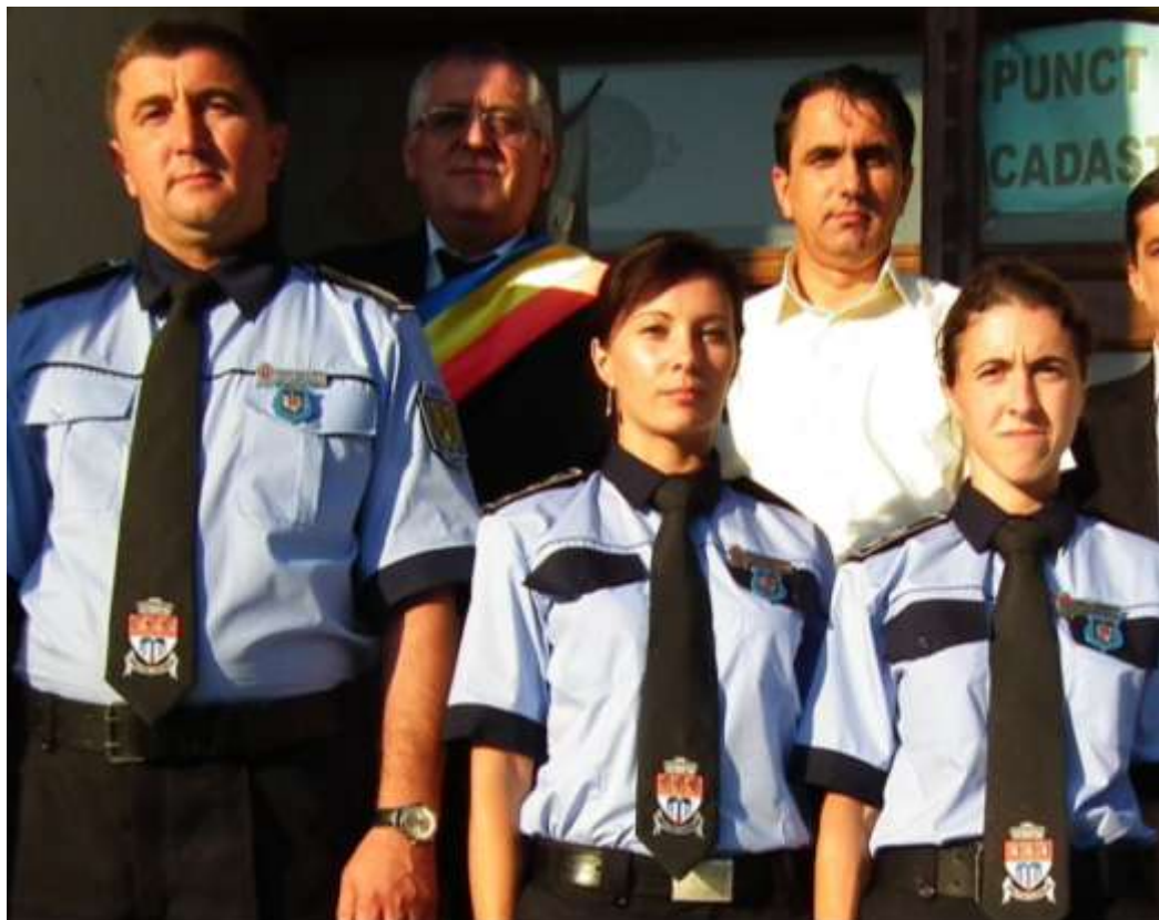
Poliția locală a comunei Vulcana-Băi la data de 30 august 2011

Denumirea inițială a acestei structuri a fost cea de Poliție comunitară. Începând cu 1 ianuarie 2011, aceasta se reformează și devine Poliție locală. Activitatea sa este organizată pe domenii specifice, după cum urmează: ordinea și liniștea publică, precum și paza bunurilor, circulația pe drumurile publice, disciplina în construcții și afișajul stradal, protecția mediului, activitatea comercială, evidența persoanelor; precum și alte domenii stabilite prin lege. Aceste domenii dau caracter interdisciplinar activității polițistului local, având numitor comun interesele cetățeanului.